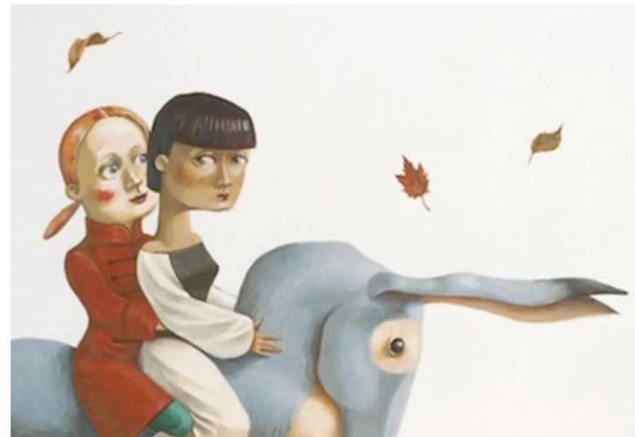
Ilustración tomada de: Titiritesa / Xerardo Quintiá .- OQO, 2007. ROJO La pequeña intolerancia / Mar Pavón .- Tramuntana, 2018. ROJO