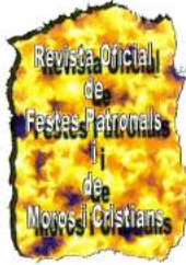
Portada Autor: J. RUIZ